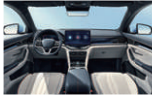
Azul y gris