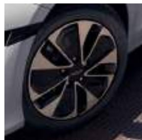
Llantas de aleación de 40 cm (16") (Concept | Drive)