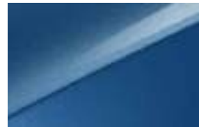
Blue Flame (B3L) No disponible en Style Edition