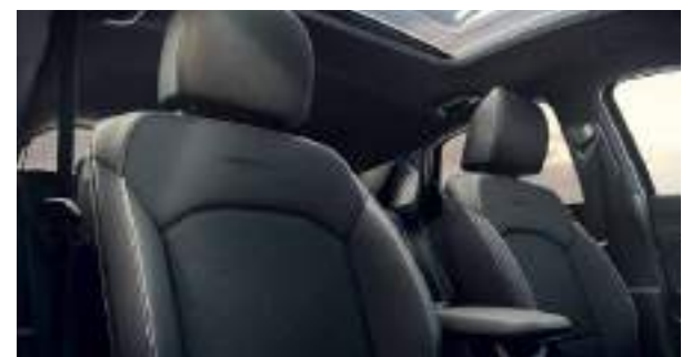
Tapicería GT-line Pack Premium Ceed | Ceed Tourer | ProCeed