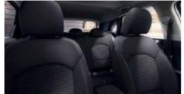
Tapicería en tela (Drive) Ceed | Ceed Tourer