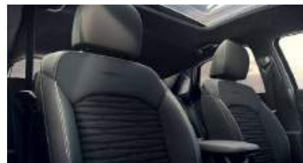
Tapicería GT-line Ceed | Ceed Tourer | ProCeed