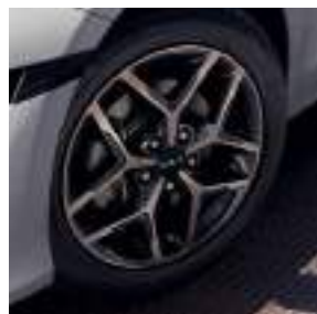
Llantas de aleación de 43 cm (17") (Tech)