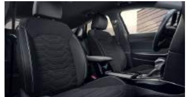
Tapicería Style Edition Ceed