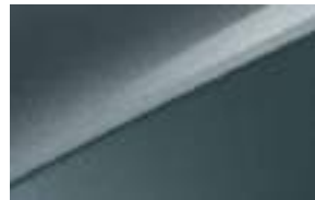
Yucca Steel Gray (USG) No disponible GT-line