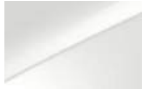
Casa White (WD) No disponible GT