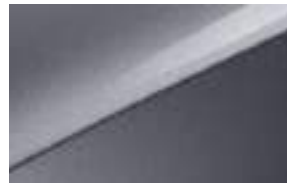
Lunar Silver (CSS)