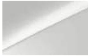
Deluxe White (HW2)