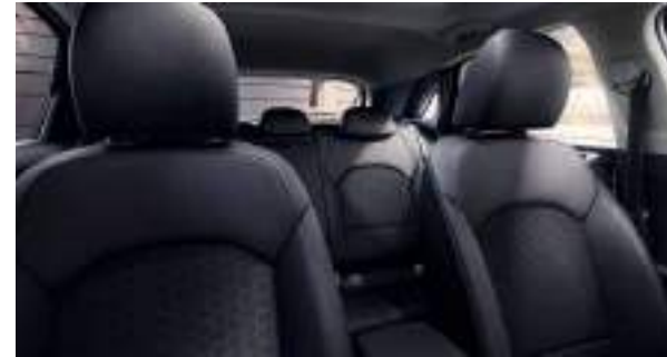
Tapicería en tela (Concept) Ceed | Ceed Tourer