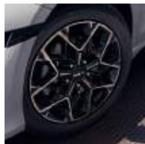
Llantas de aleación de 43 cm (17") (Style Edition | GT-line)