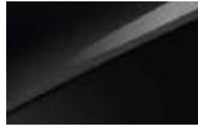
Black Pearl (1K)