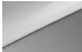
Wolf Gray (Solo disponible en Style Edition)