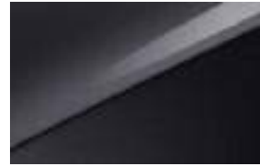
Penta Metal (H8G)