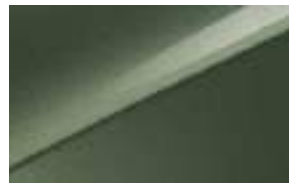
Experience Green (EXG) No disponible en Style Edition