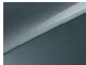
Yucca Steel Gray (USG)