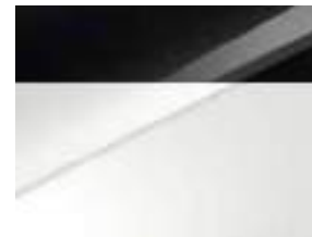
Pearl black & Deluxe white (HA2)