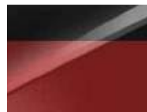
Pearl black & Infra red (HA7)