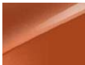
Orange fusion (RNG)