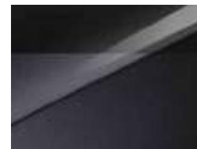
Pearl black & Yucca Steel Gray (USG)