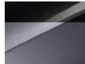
Pearl black & Lunar silver (HA5)