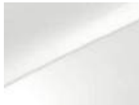
Casa white (WD)*