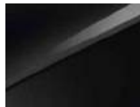
Pearl black (1K)