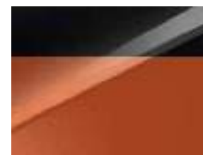
Pearl black & Orange fusion (HBB)