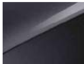
Penta metal (H8G)