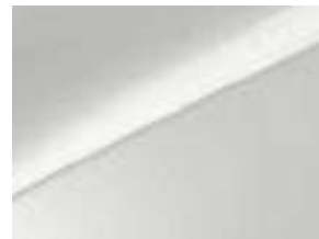
Deluxe white pearl (HW2)