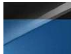
Pearl black & Blue Flame (B3L)