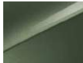
Experience green (EXG)