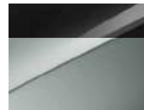
HBM / Wolf Grey / Pearl Black (Solo disponible en Edición 30 aniversario)