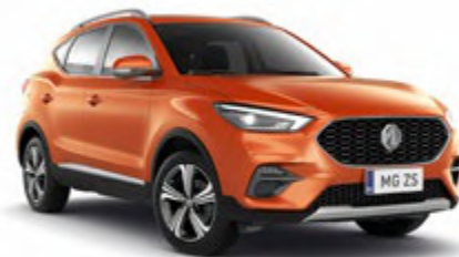
Hoxton Orange (metalizado)