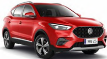
Dynamic Red (Tri-Capa)