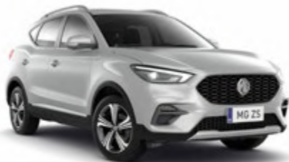
Monument Pearl (metalizado)